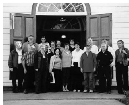
Groupe de travail devant l'église Kiamika, entouré de quelques familles d'accueil.

Né de l'idée et de la détermination d'un ancien maire de Kiamika à faire venir et à retenir des visiteurs dans sa région pour leur faire partager une expérience « de terrain », le Village d'accueil des Hautes-Laurentides entend proposer une formule « nouvelle génération » de ce type d'hébergement. Fonctionnant en tant qu'entreprise d'économie sociale, l'organisme a vu le jour grâce à la volonté et à la collaboration des