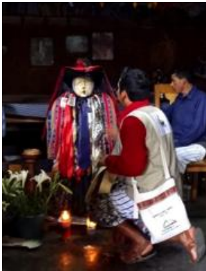
Le fameux Maximón, que l'on fait boire et fumer pour s'attirer de bonnes augures! Le synchrétisme s'arrête ici, car le culte voué à ce saint est fortement ancré dans les croyances maya.