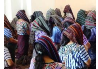
Une prière communautaire pendant laquelle on entend un fervent réciter ses péchés à haute voix parmi le groupe qui s'incline devant un petit autel. L'intensité de la dévotion et de la croyance ne peut faire autrement que de nous émouvoir.