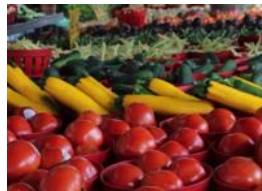
La corde de légumes