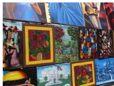
Les artistes de rue, bavards chaleureux, où copies et originales se côtoient !