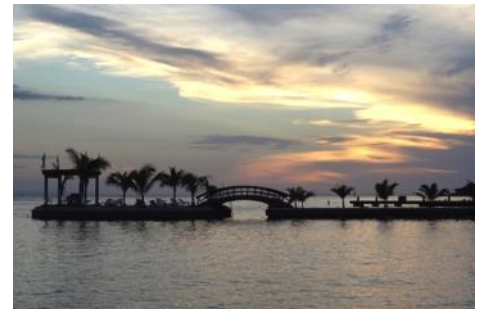
Petit oasis sur la Côte des Arcadins, en proie à reprendre le pli du tout inclus.