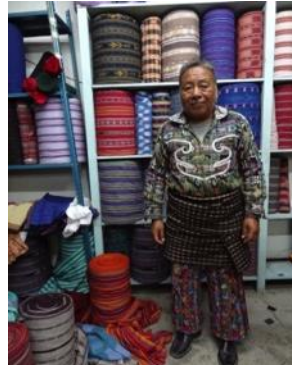
La boutique où j'achète les tissus qui deviendront de jolies nappes! Et que dire de la magnifique tenue quotidienne du magasinier!