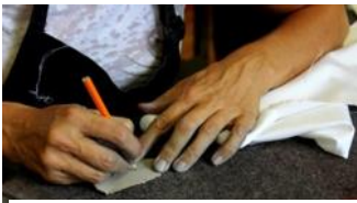
Mains d'artiste à l'oeuvre

La photographie continue d'être une activité qui m'est chère et chaque occasion est bonne pour m'y entraîner. Ci-dessous, quelques résultats de mes essais photographiques lors de l'atelier de photos à l'École d'été de Mont-Laurier. Les sujets à l'étude : architecture, nature, personnages, artistes, photos de nuit, cinq jours à expérimenter des lieux, des lumières, des mouvements, des couleurs et des trucs insolites !