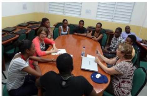
En grande discussion avec les étudiants de l'Université Quisqueya.