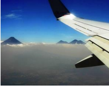
Pas encore débarqués de l'avion, qu'on sait déjà qu'on entre au pays des volcans!