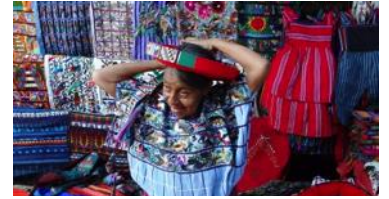
Faut enrouler le bandeau long de 30 mètres chaque matin! Démo : http://bit.ly/19p5RaP . C'est l'une des activités que la communauté de Santiago a mis sur pied en faisant participer les visiteurs.