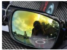
Photographe se photographiant, un 'selfie'