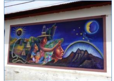
Une murale de San Juan La Laguna dépeignant l'un des 13 Baktun de la culture maya. Une initiative d'artistes locaux dans le cadre des célébrations de la fin du calendrier maya et du début d'un nouveau monde...