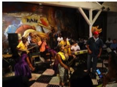
Les jeudis endiablés du groupe RAM à l'Hôtel Oloffson.