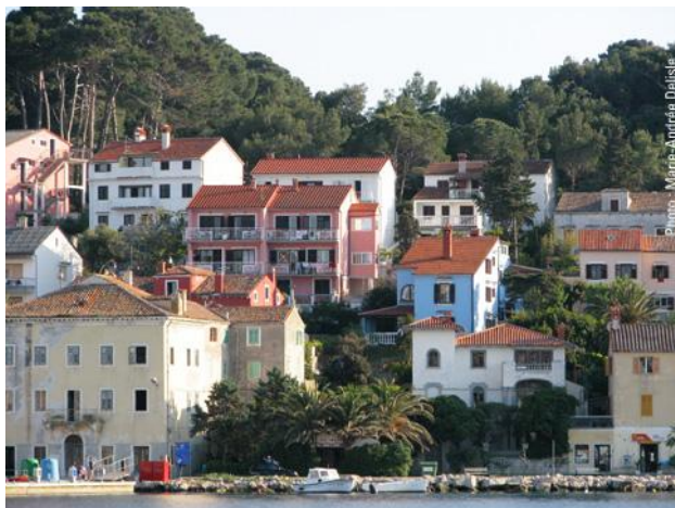
Mali Losinj, sur l'île de Losinj