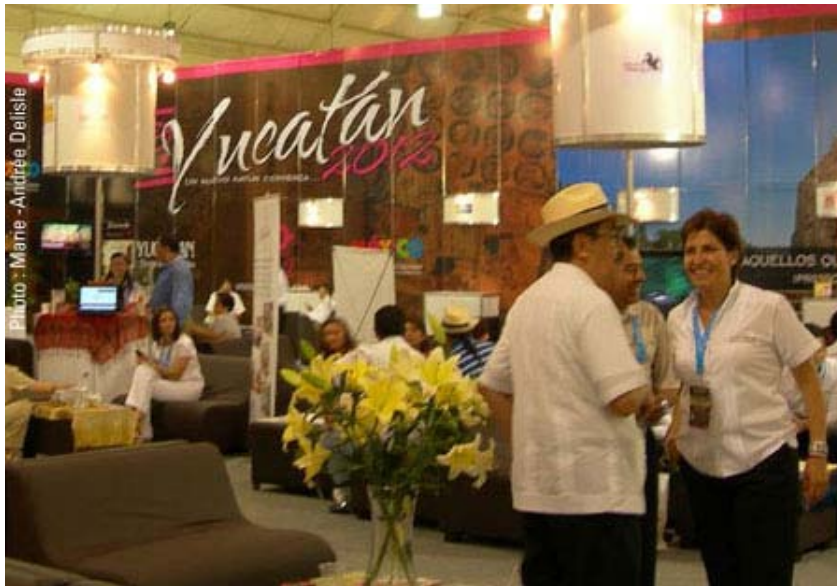
Atmosphère décontractée de la Féria