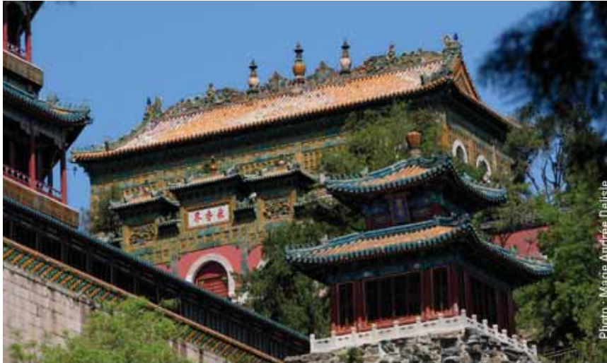
Le Palais d'été