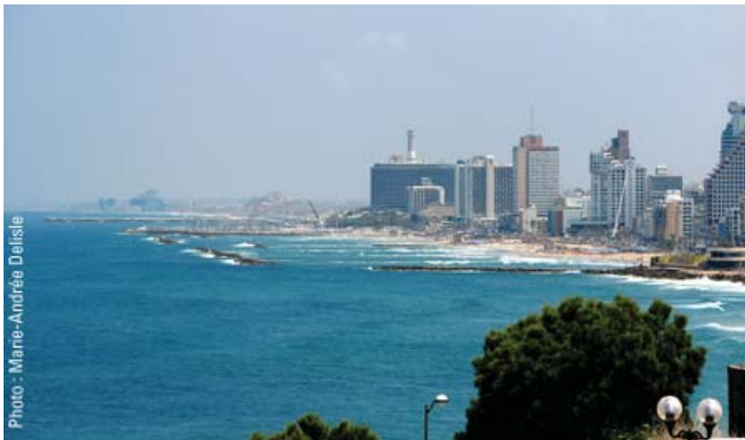
Au bord de mer à Tel Aviv.