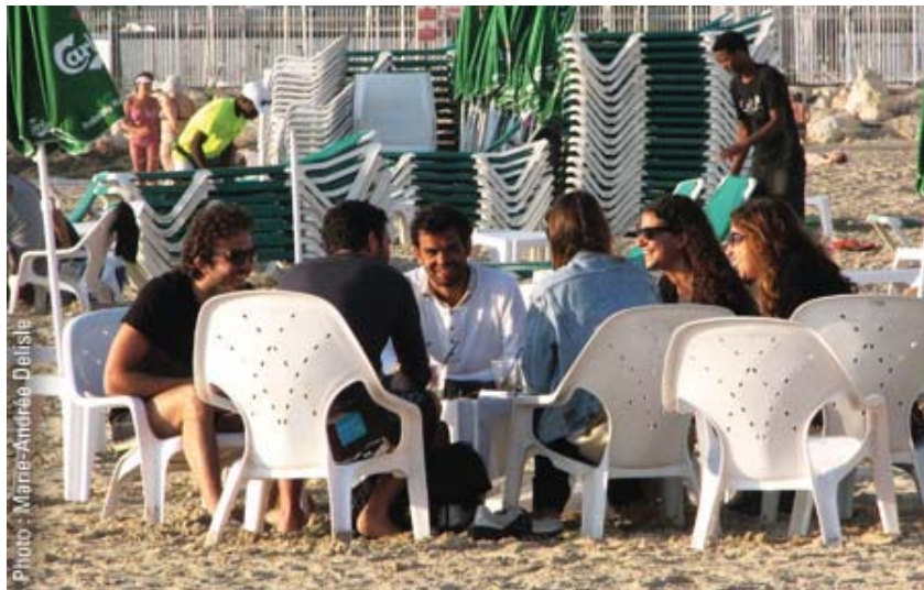
À Tel Aviv, dans l'action.