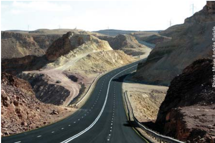
La route entre Eilat et Tel Aviv.

Carte postale n° 3 d'Israël, cliquer ici