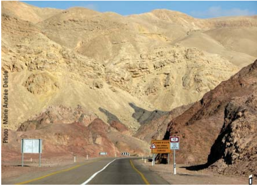
La route entre Eilat et Tel Aviv.